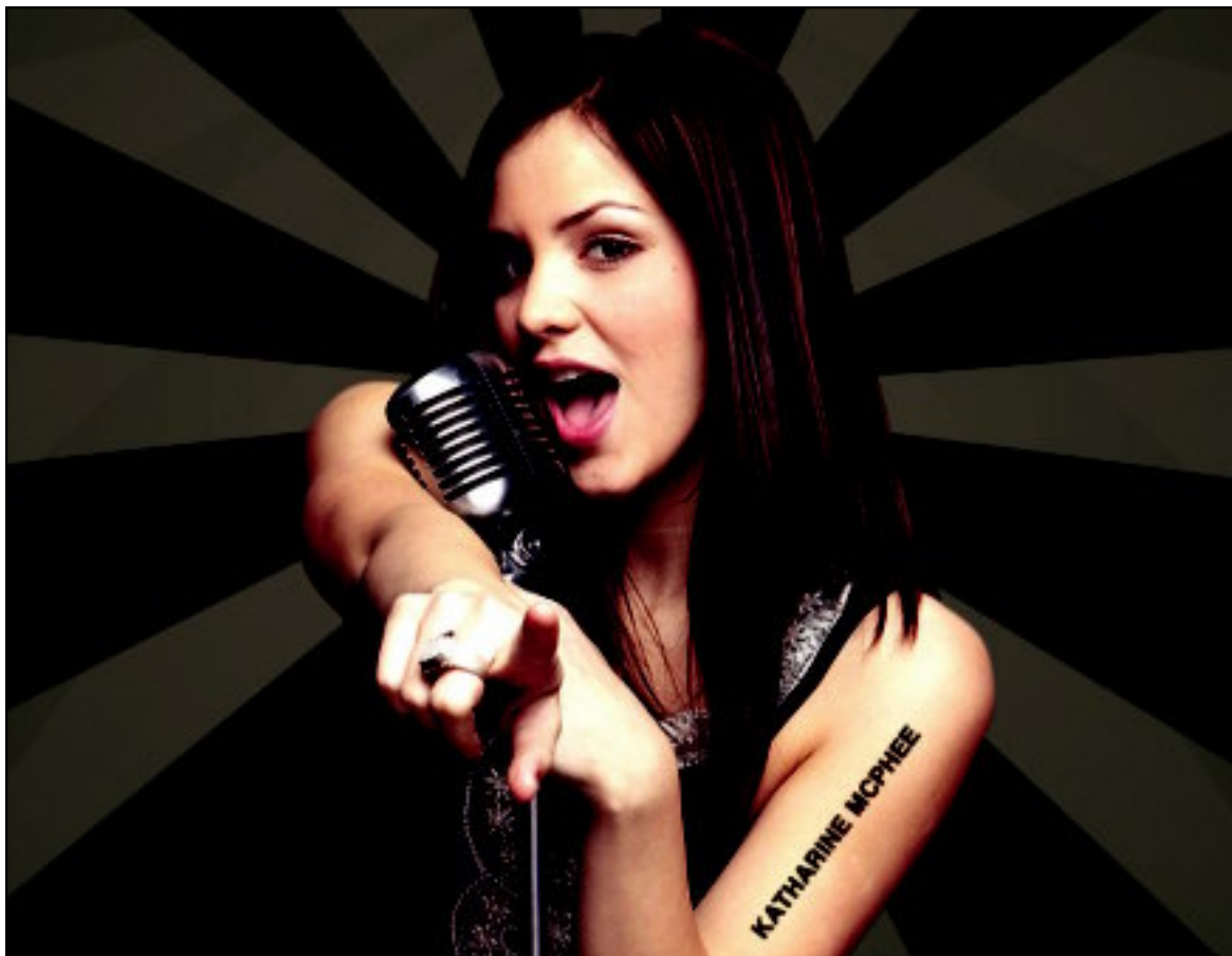
Katharine McPhee trở về với âm nhạc và lập tức đăng quang là Thần tượng Hoa Kỳ trong chương trình American Idol.