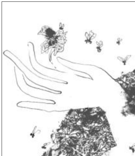
VIỆT BÁO TẾT

mỗi tuần, tiếng chuông ngân lên, vết thương bật khóc trên bãi biển anh đứng ngơ ngác như mùa đông nhìn ra khơi ngày thứ hai, trong quán nhỏ buổi chiều và một phần đời anh đã nắm được tay nhau chúng reo hò.