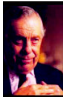
Nhà báo Morley Safer, giải Pulitzer về báo chí thời chiến tranh VN, gọi Hà Thúc Cần - đạo diễn phim Đất Khổ - là "một người phi thường."

Ông kể lại bối cảnh của biến cố này, mặc dù diễn ra trong năm 1965, nhưng không khác gì chuyện chiến tranh Iraq năm 2007.